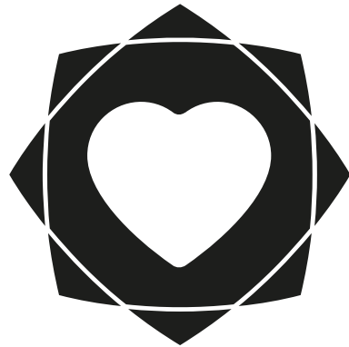
1 Cor Positiva